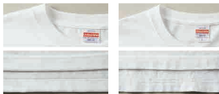
未着用の5001-01(左)と、1年間着用した5001-01(右)

5.0~7.0オンスが一般的に「ヘヴィーウェイト」とよばれる生地厚で、「5.6オンス」は一枚で着用できるちょうど良い生地感と強度を兼ね備えています。丈夫で長く着用できるので、洗濯を繰り返してもへたれません！