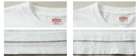
未着用の5001-01(左)と、1年間着用した5001-01(右)

5.0~7.0オンスが一般的に「ヘヴィーウェイト」とよばれる生地厚で、「5.6オンス」は一枚で着用できるちょうど良い生地感と強度を兼ね備えています。丈夫で長く着用できるので、洗濯を繰り返してもへたれません！