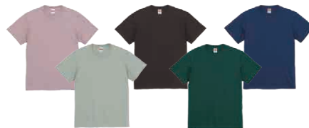
2023SSから新たに登場した期間限定色の「リミテッドカラー(全5色)」

「みんなでおそろいのTシャツを作りたい」「店舗スタッフのユニフォームに」といった需要には、カラバリの豊富さで答えます。コーポレート・スクールカラーにも答えられる56カラーのラインアップにはきっとお探しのカラーがあるはず。